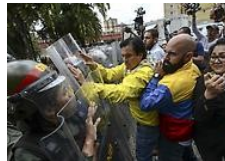
Justicia deja a Venezuela sin Legislativo; surgen protestas