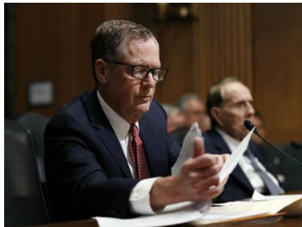
Lighthizer advirtió que México y EU se necesitan mucho en lo económico.

Norte América | TLCAN | Estados Unidos | Canadá | Exportaciones | Donald Trump