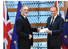
Reino Unido entrega carta que lanza ruptura con la UE