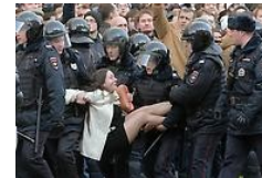
Detienen a centenares en multitudinarias protestas en Rusia

EL INFORMADOR valora la expresión libre de los usuarios en el sitio web y redes sociales del medio, pero aclara que la responsabilidad de los comentarios se atribuye a cada autor, al tiempo que exhorta a una comunicación respetuosa.